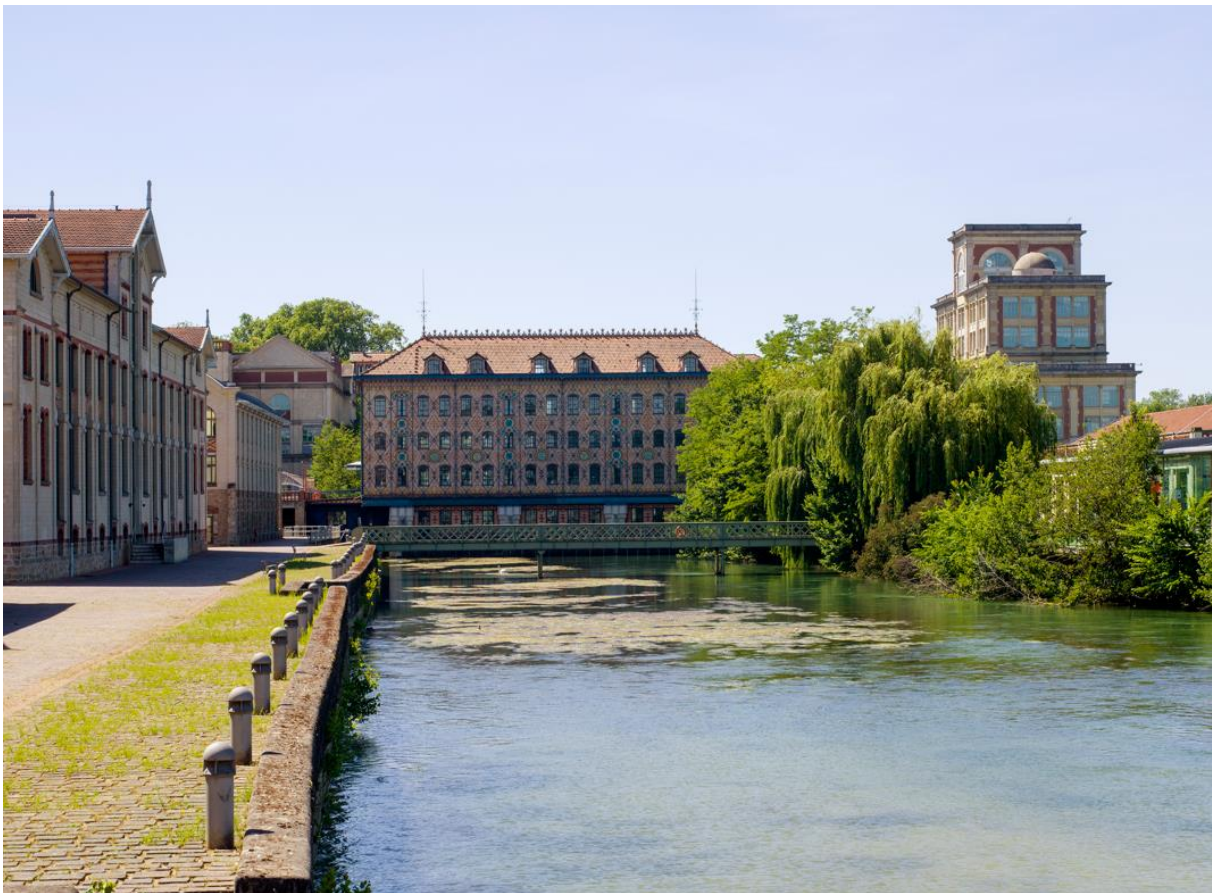
Vue sur le Moulin Saulnier et la Cathédrale