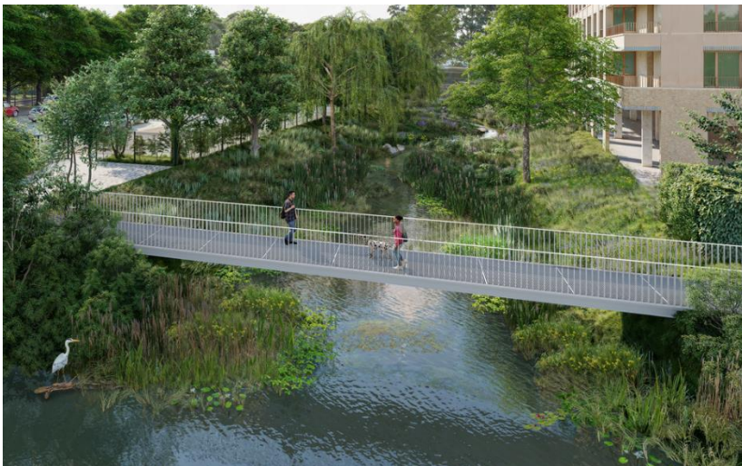
Perspective depuis la Marne du rû Maubuée renaturé